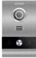
MILO 1W PANEL