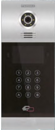
MILO DIGITAL PANEL