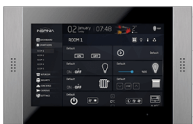
ASTRUM INSPINIA TOUCH SCREEN