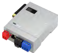
ASTRUM INSPINIA MINI SERVER