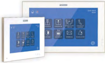
MONITORES WIT 7" Y 10"